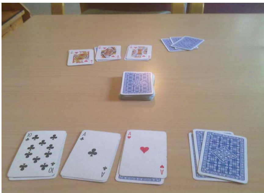
Overblikksbilde før start.