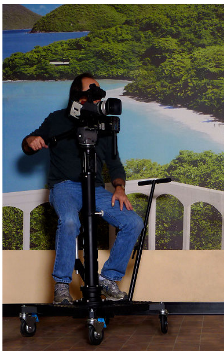
Dolly på hjul