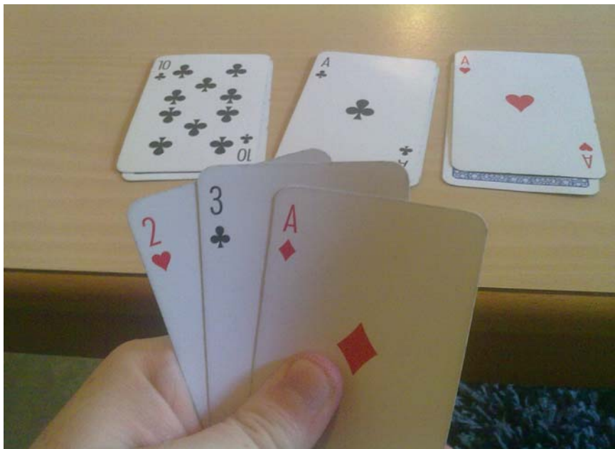
Et godt utgangspunkt i starten.