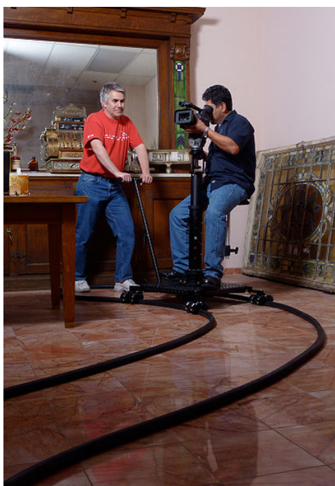
Dolly på skinner